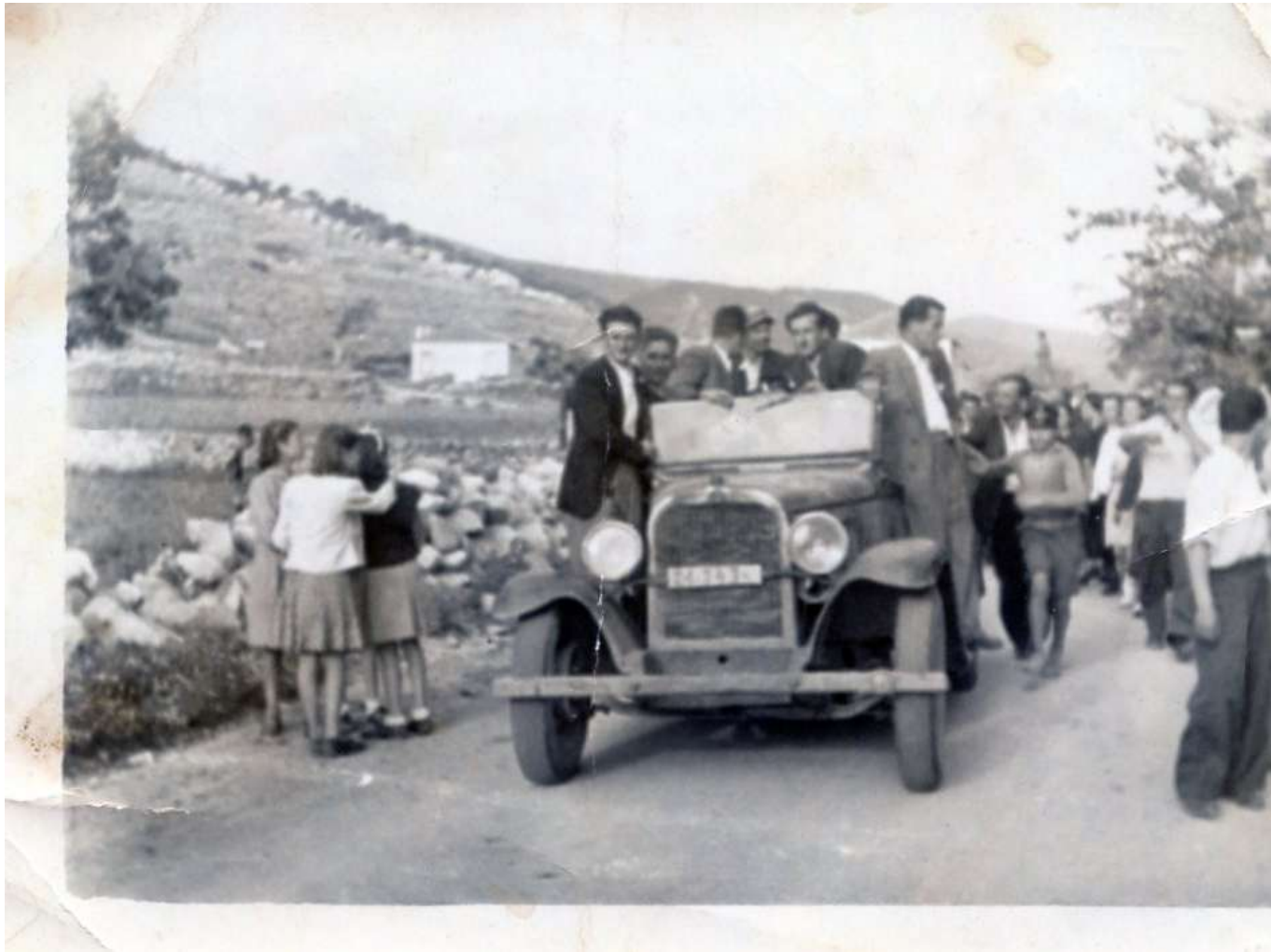
Το φορτοταξί .....καταφθάνει στο χωριό μας έμφορτο.