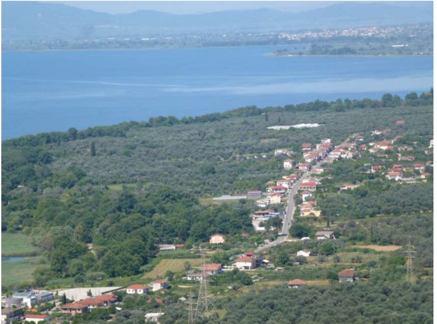
Ο κεντρικός οικισμός της Παντάνασσας.