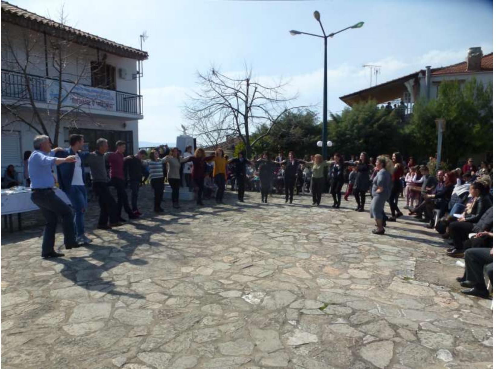
Από εκδήλωση του Συλλόγου.2017 « .....και ο χορός ...καλά κρατεί....» στη πλατεία του χωριού.