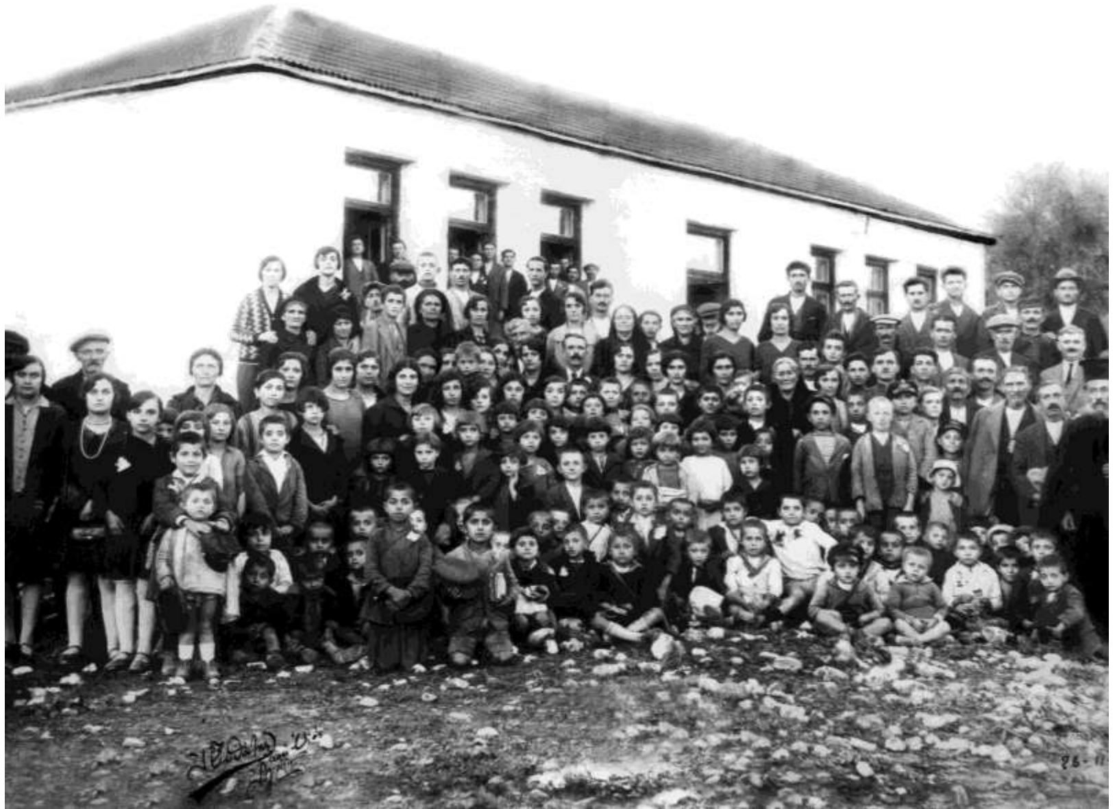
Σχολική χρονιά: 1929-Δάσκαλοι, Μαθητές και Γονείς.