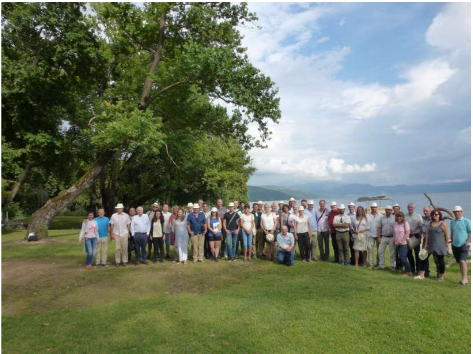
Η ετήσια επιστημονική συνάντηση της Πανευρωπαϊκής Ένωσης Παραγωγών φαρμακευτικών Φυτών (EUROPAM) στη Ντουαγρή. 2018.