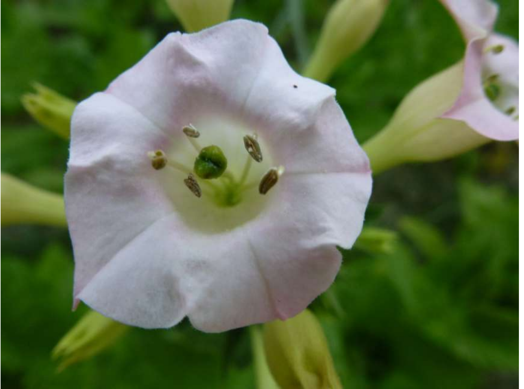
Το λουλούδι .....της πέτρας, του αγώνα και της οικονομικής ζωής των ανθρώπων της περιοχής για εκατοντάδες χρόνια