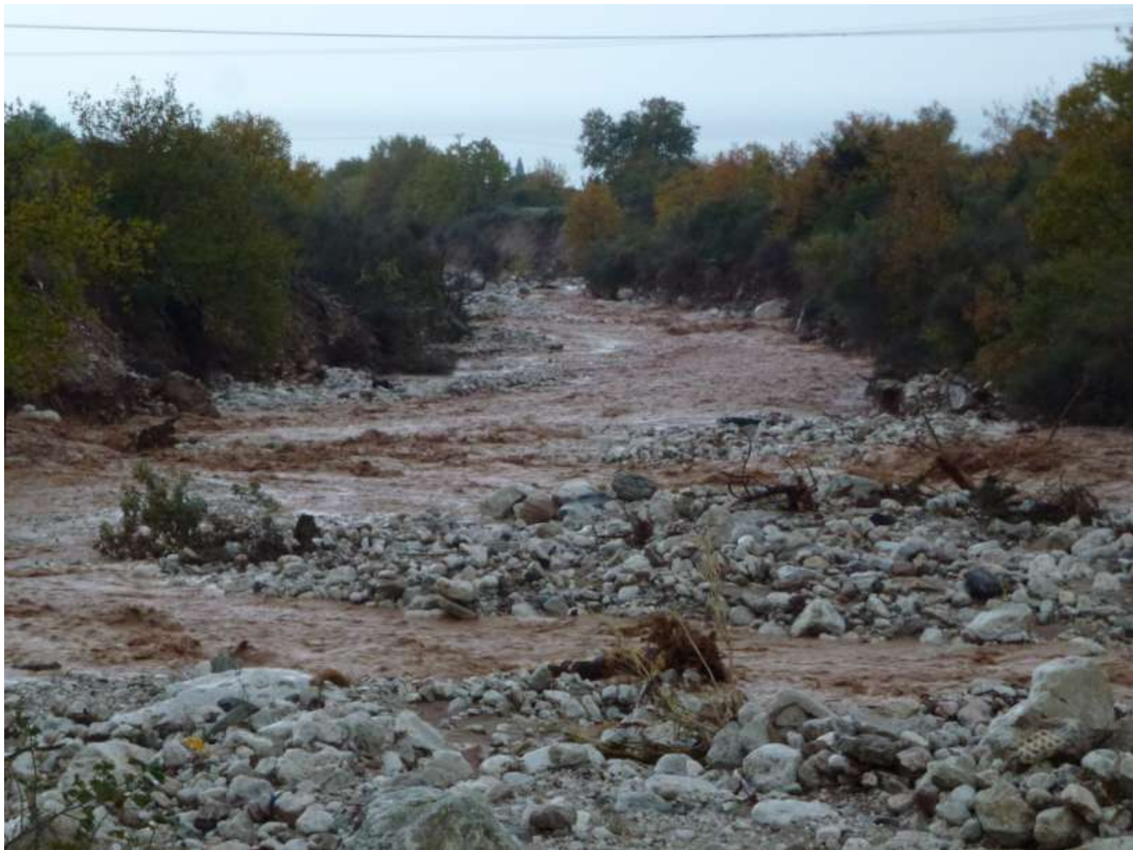
Ο Ξηριάς .....σε δράση