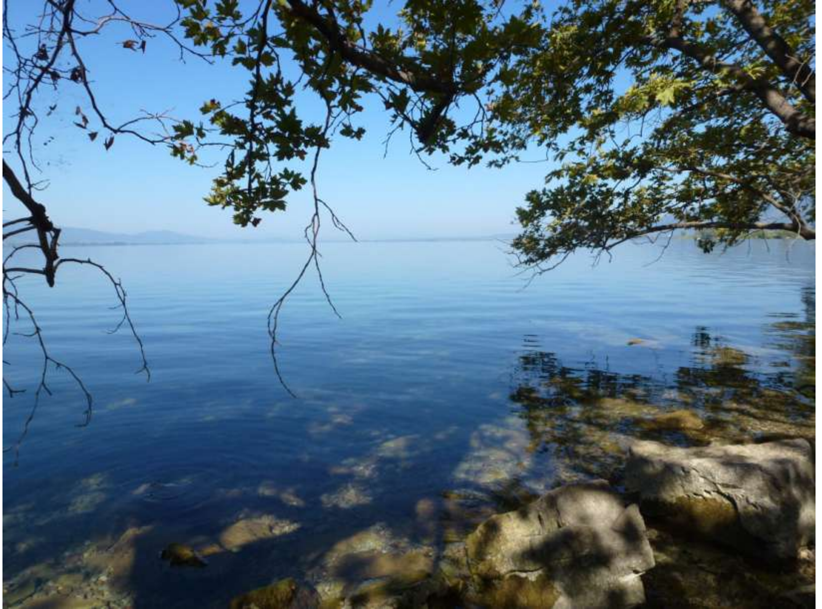
Η απεραντοσύνη και τα πεντακάθαρα νερά της Τριχωνίδας, 2018