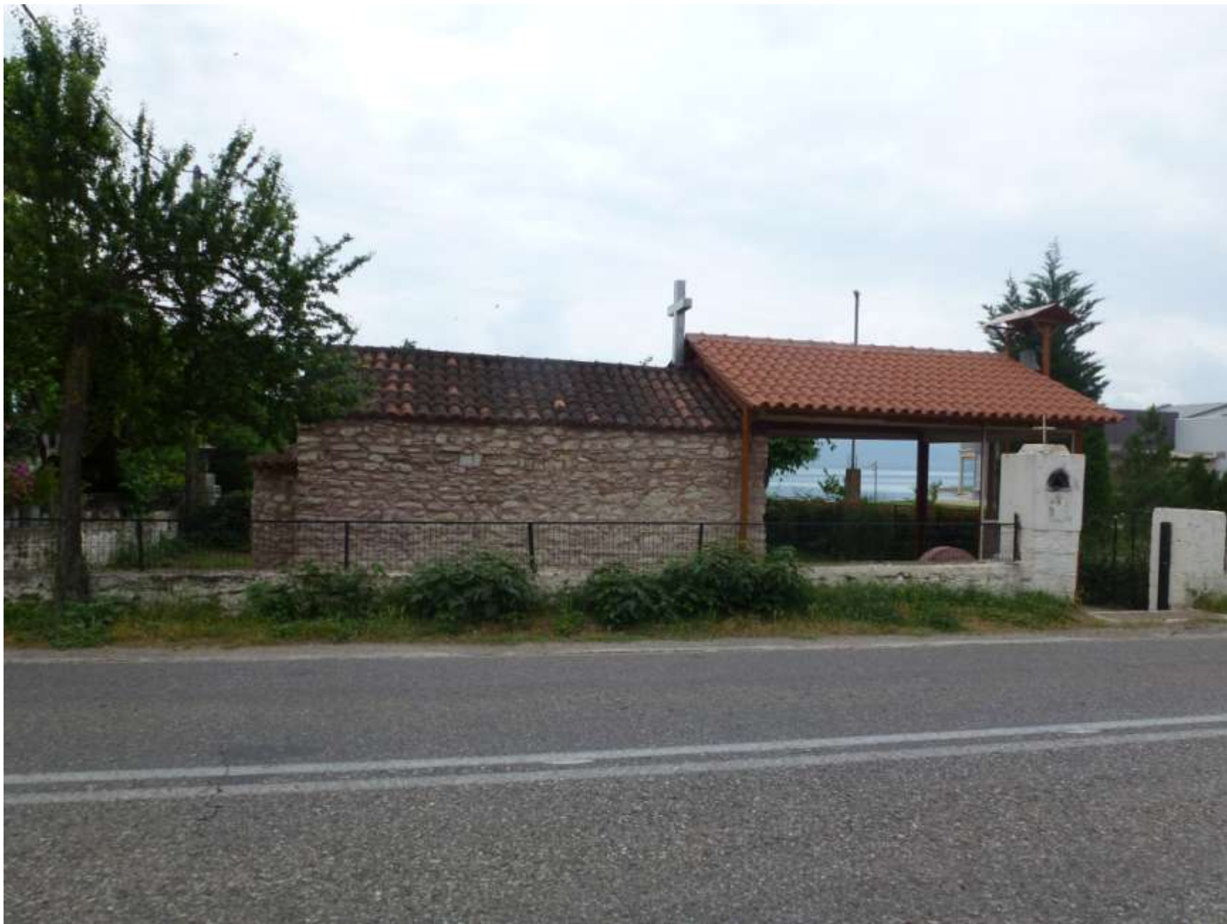
Το εκκλησάκι του Αγίου Νικολάου στην Ντουγρή