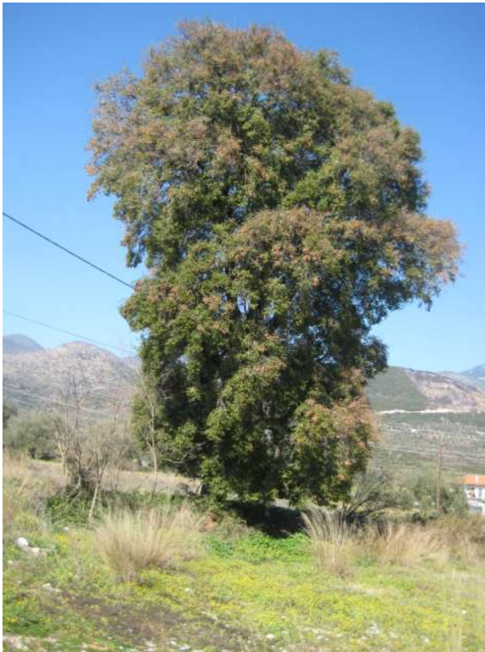
Φωτο: Η.Δ.Ντζάνης. Το Πουρνάρι του Τσιμπλή. Μνημείο της φύσης που δυστυχώς κόπηκε.