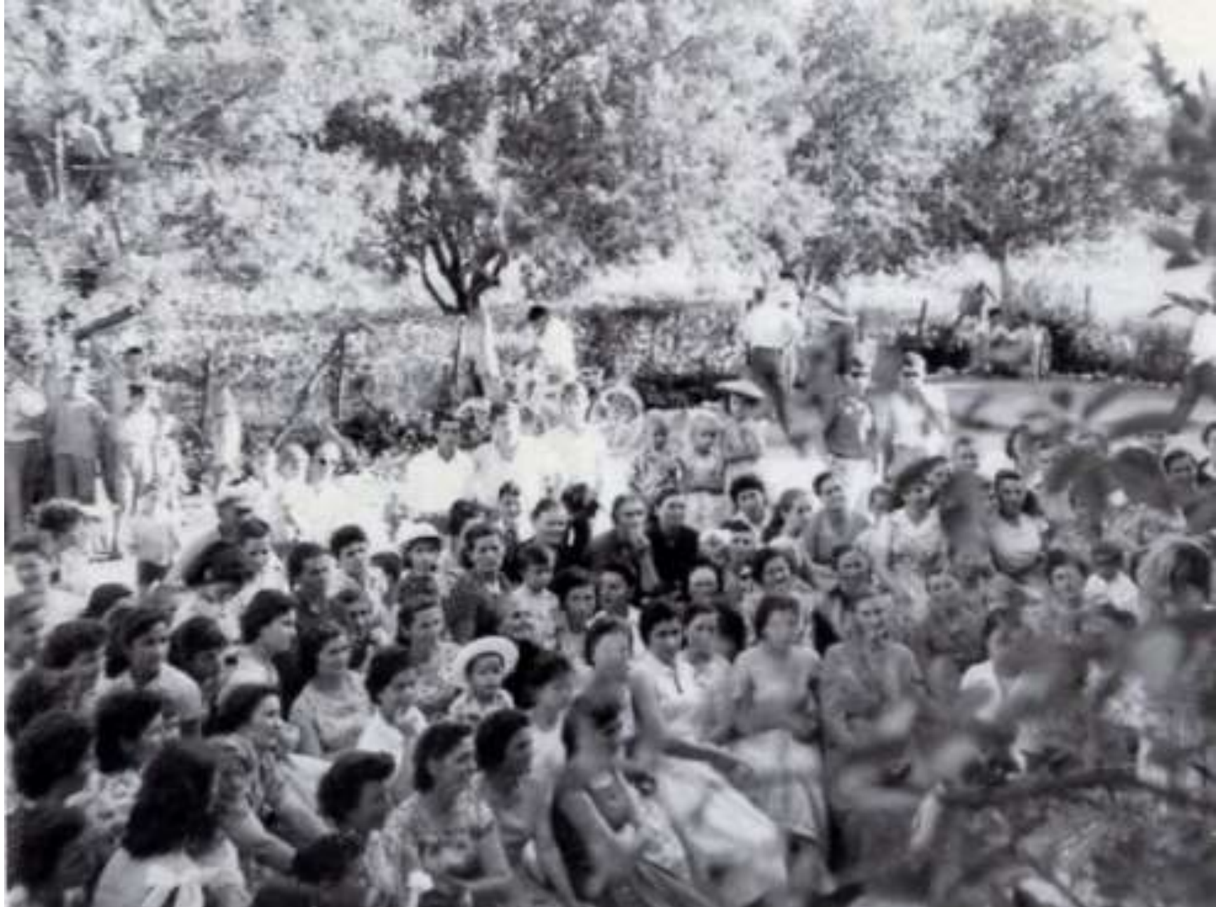
Αρχείο: Κ. Αθ. Δεληγιάνης. «...γυναικοσύναξη... κάπου,.... κάποτε στο χωριό μας».