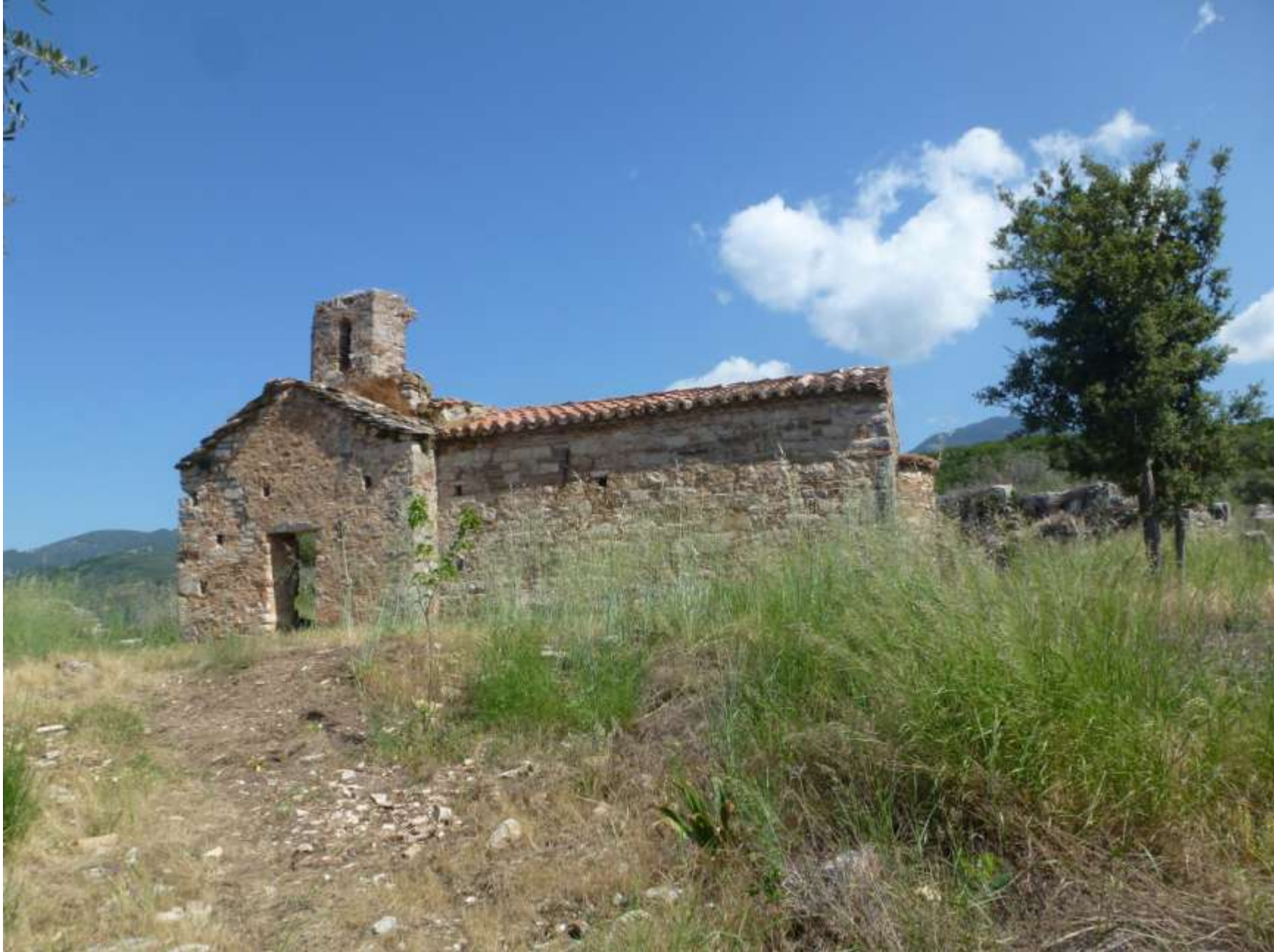
Το μοναστήρι των Αγίων Αποστόλων της Νερομάννας. «Το παλιομονάστηρο» περιμένει τη φροντίδα όλων μας.