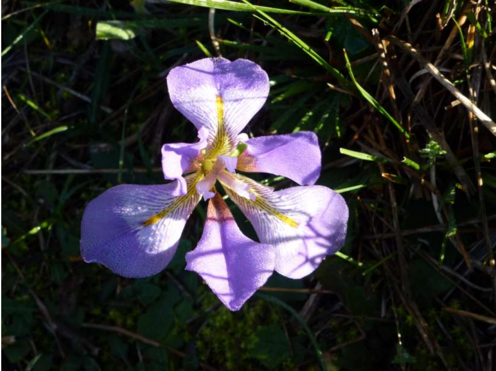
Άγρια Ίριδα. Από τα ομορφότερα αγριολούλουδα του χωριού μας.