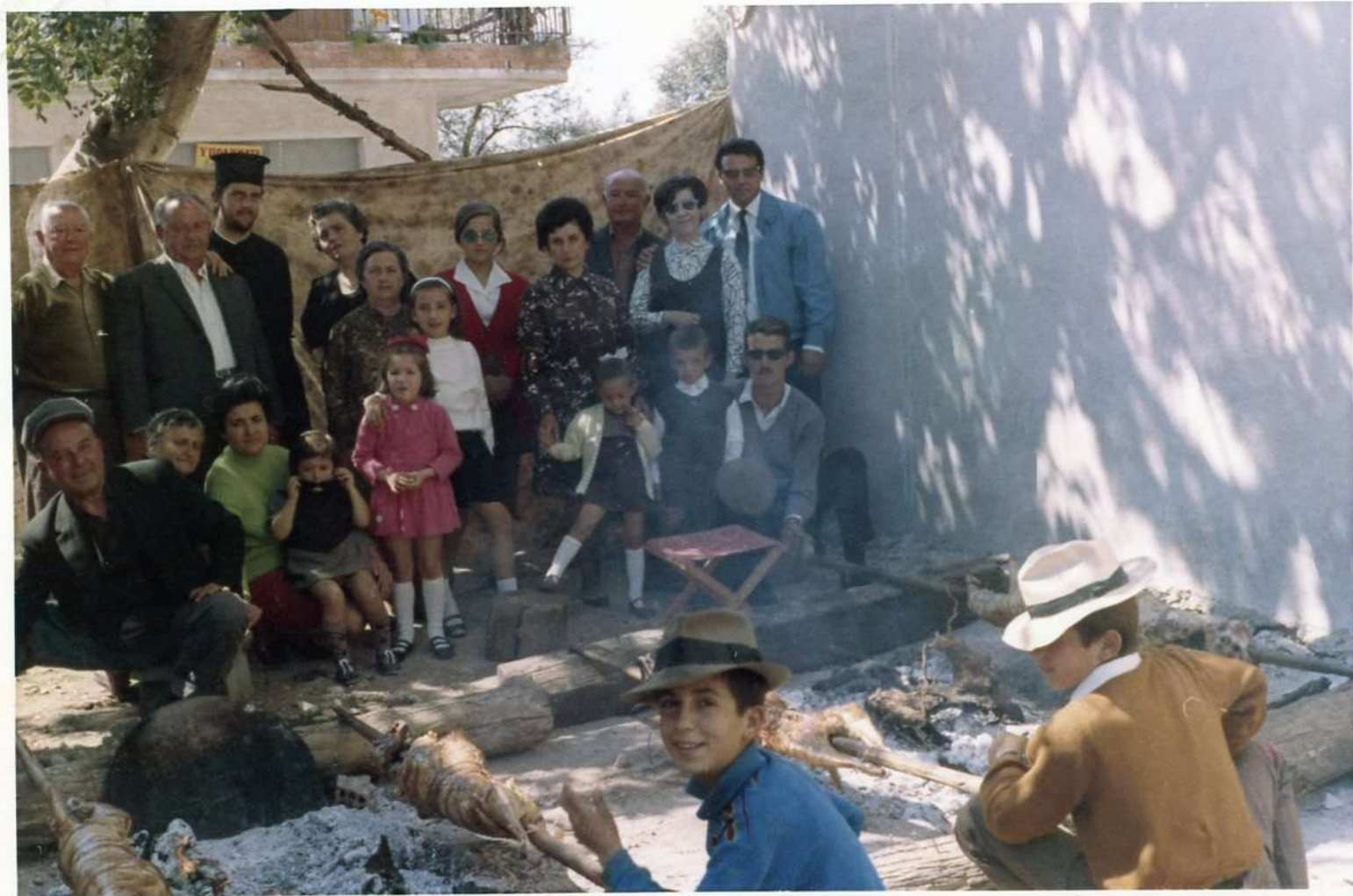
Πάσχα στο χωριό με συγγενείς και γείτονες