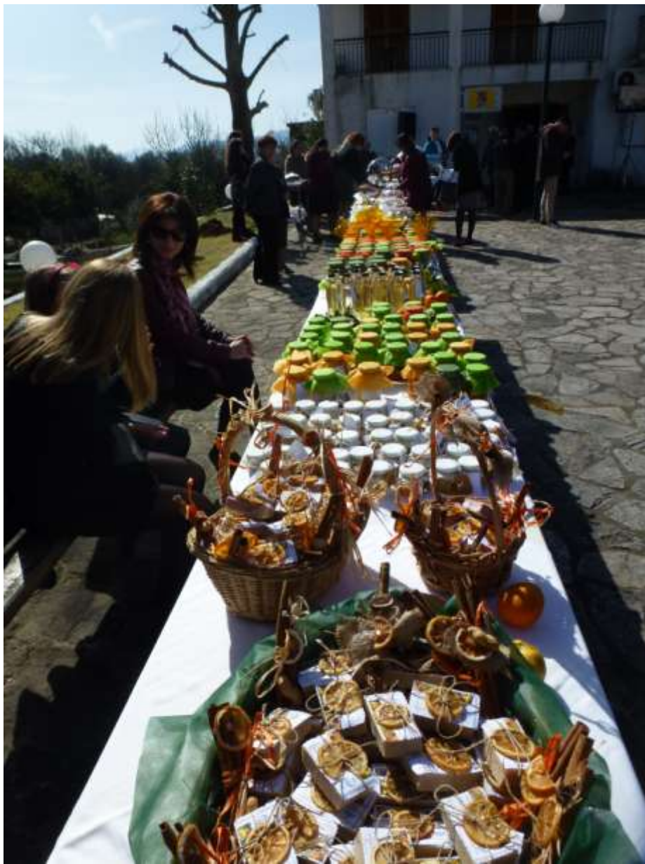
Γιορτή εσπεριδοειδών 2018. Εκθέματα γλυκισμάτων και προϊόντων παραγωγής των γυναικών του χωριού μας.