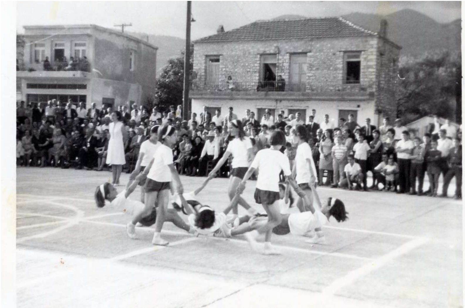
Αρχείο Δημ. Σχολείου Παντάναςσας Γυμναστικές επιδείξεις στη πλατεία.