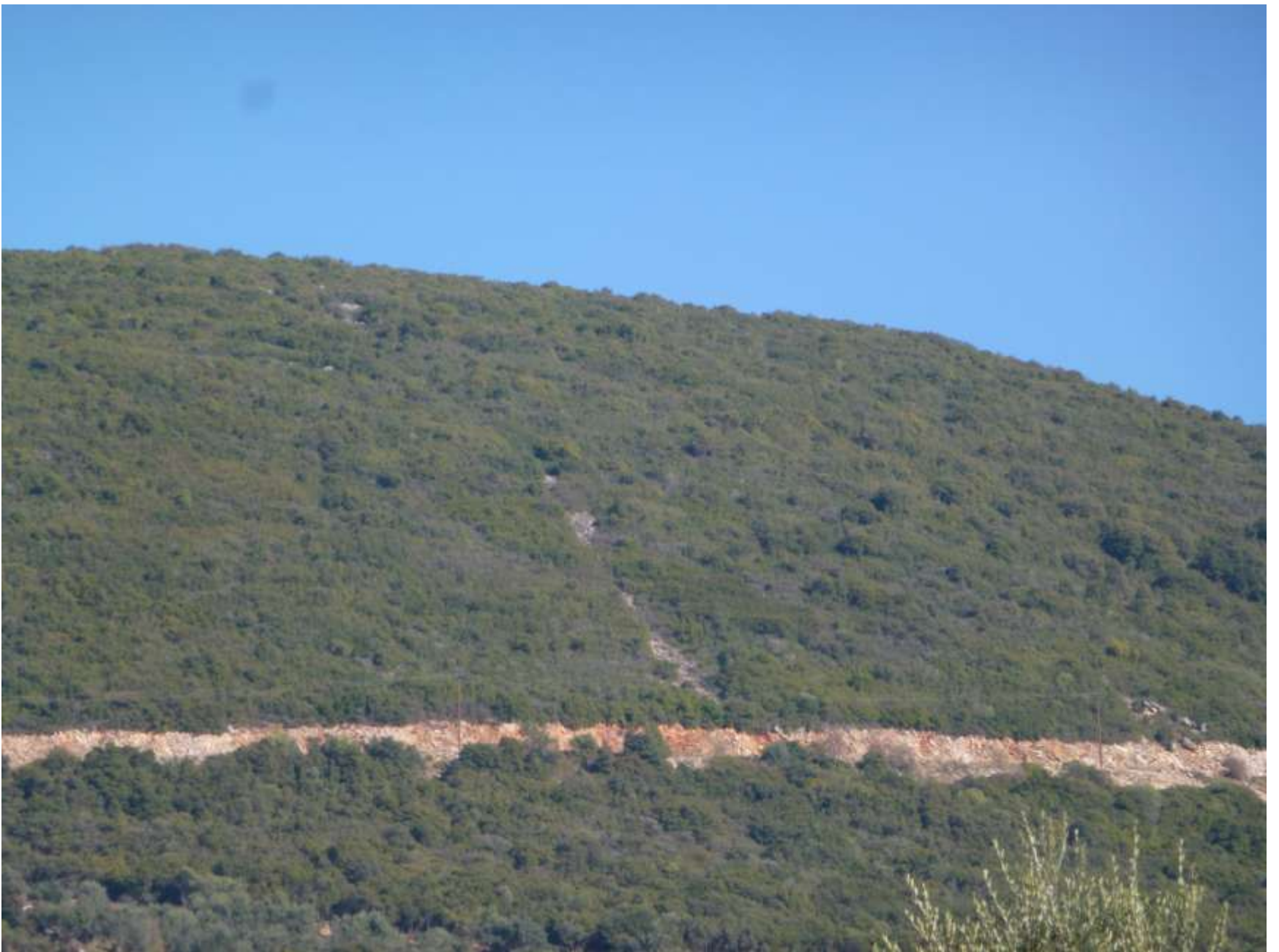
Τα ίχνη ( η κάθετη γραμμή) από το «Βίντσι του Τασσιόπουλου».