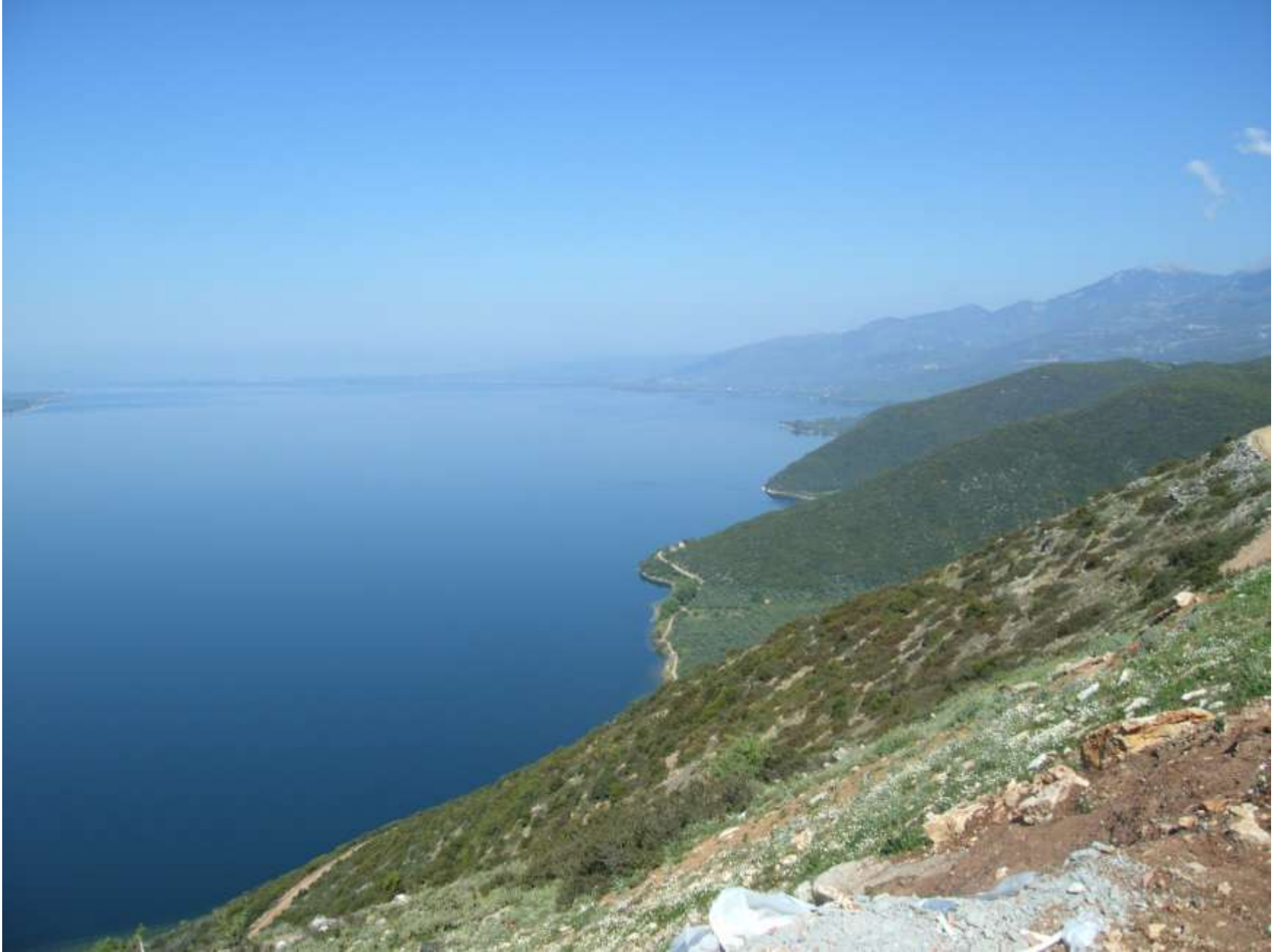
Φωτο: Η.Δ. Ντζάνης. ....Το γαλάζιο της Τριγωνίδα από ψηλά