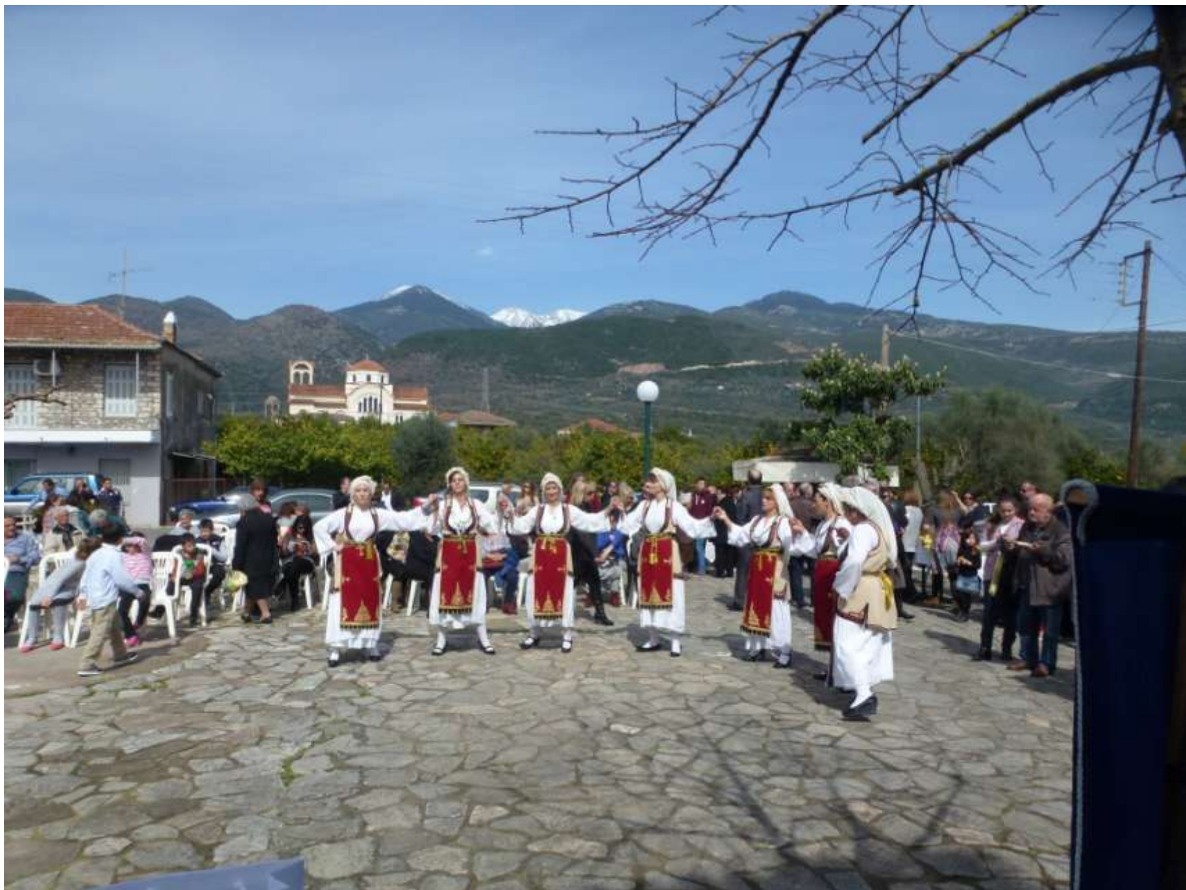
Φωτο: Η.Δ. Ντζάνης. Το χορευτικό γυναικών του χωριού μας. 2016