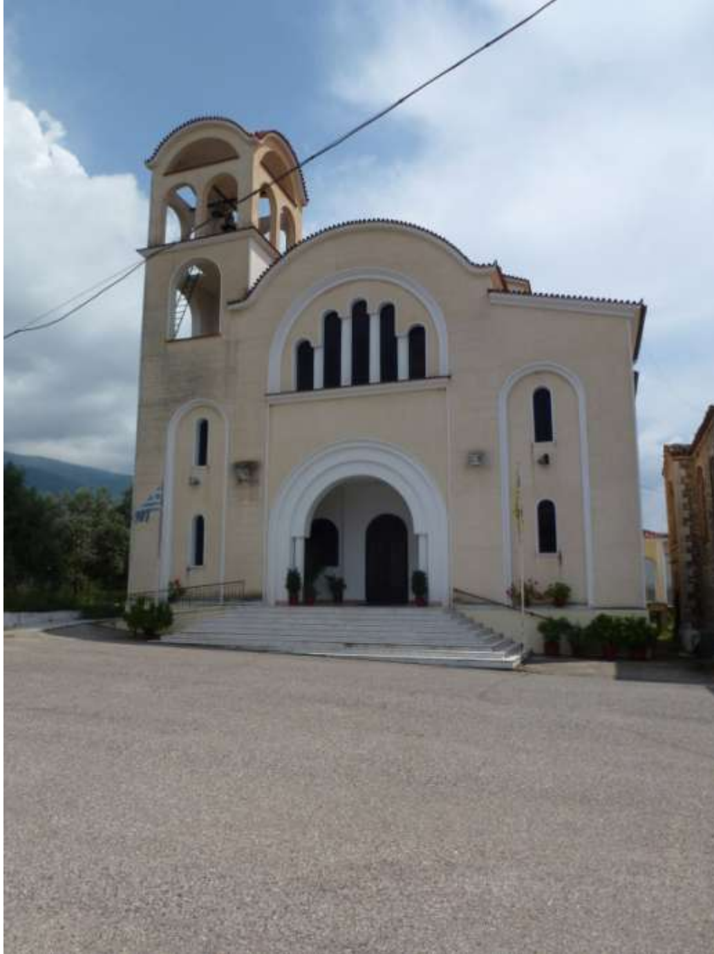
Η νέα Εκκλησία του χωριού μας.