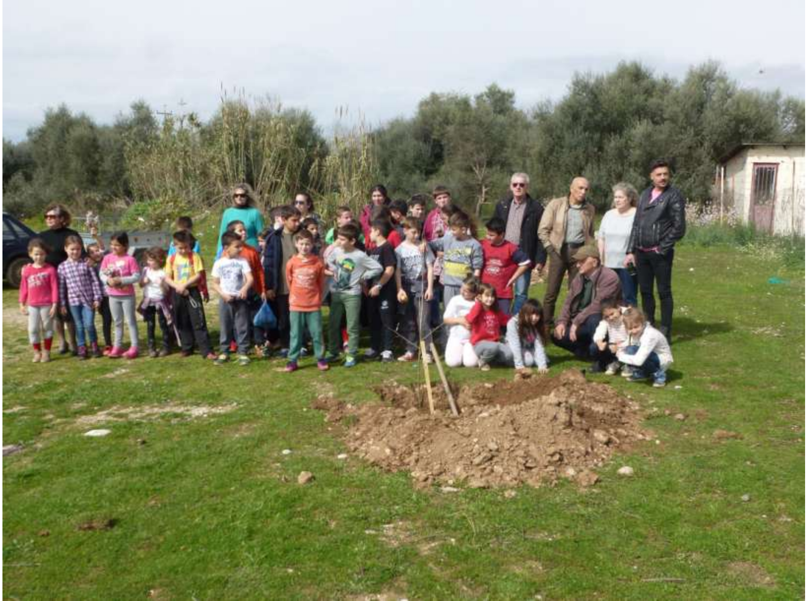
Το Δημοτικό σχολείο της Παντάναςσας σε δενδροφύτευση στο γήπεδο το 2018.