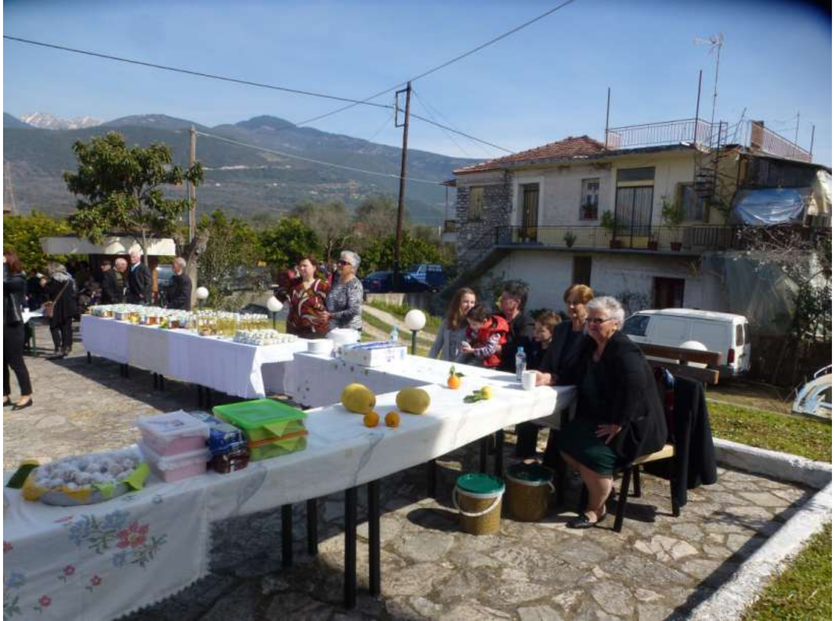
Ανάπαυλα για τις γυναίκες του Συλλόγου κατά την προετοιμασία της γιορτής εσπεριδοειδών- 2018