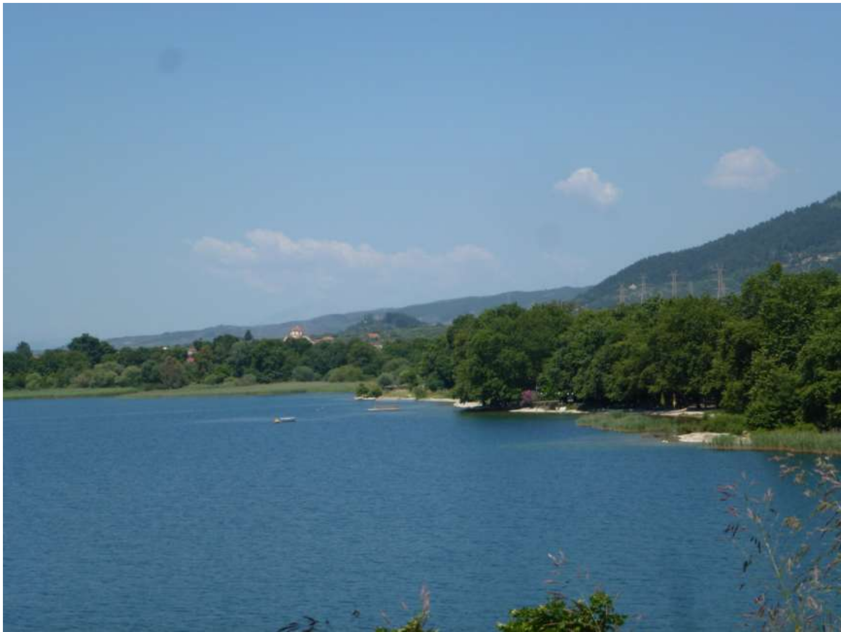
Η Ντουγρή και στο βάθος η εκκλησία του χωριού μας