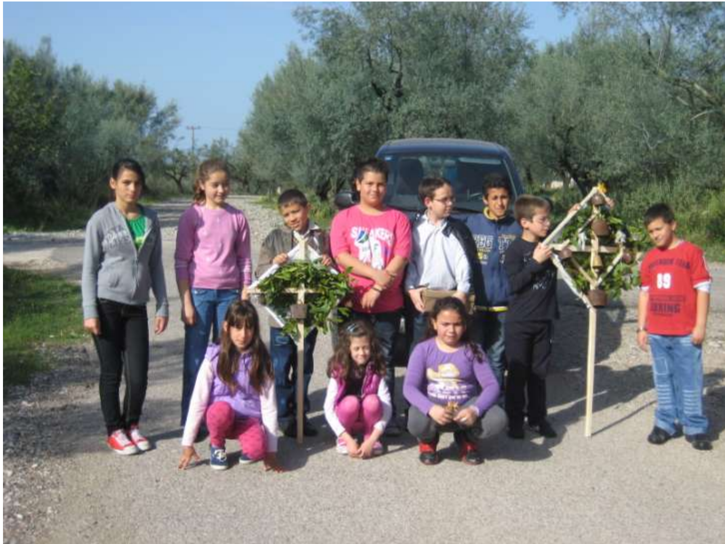
«Τα Λαζαρούδια». Τα έθιμα στο χωριό μας διατηρούνται αναλλοίωτα. Κάλαντα το Σάββατο του Λαζάρου.