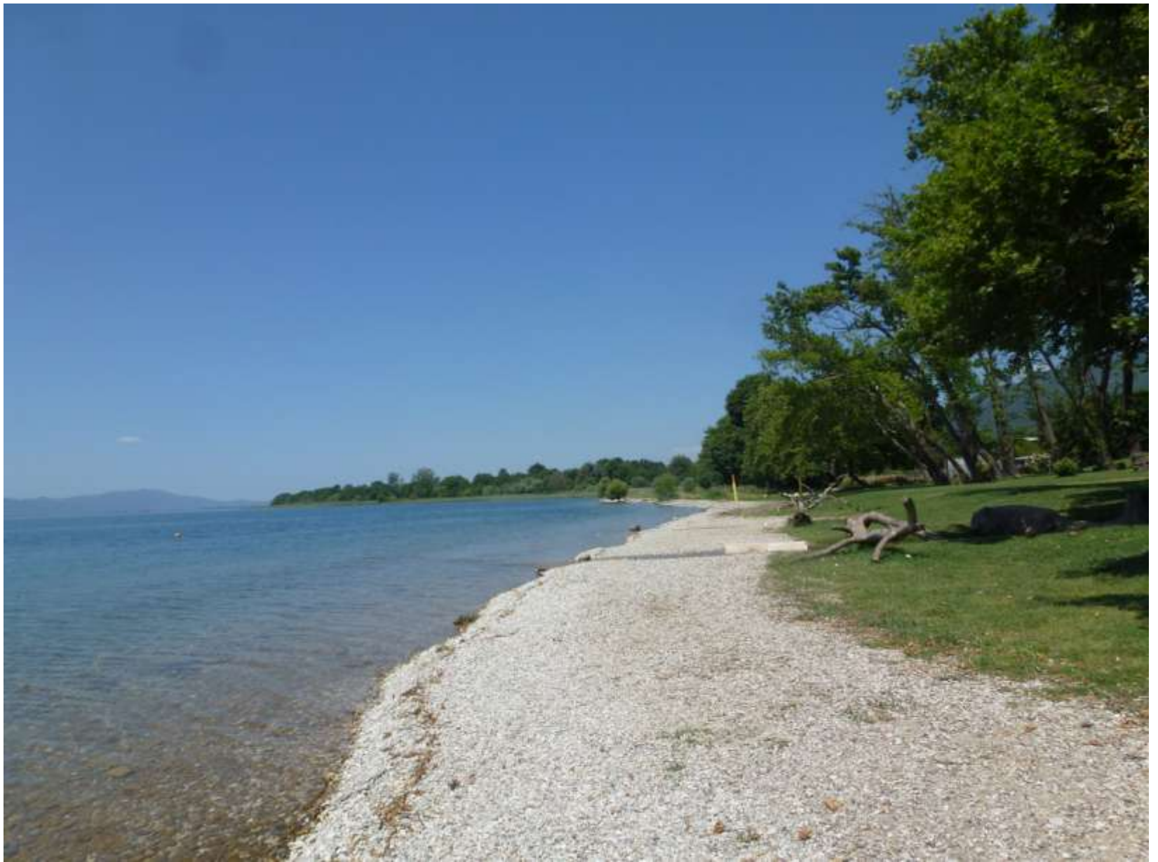
Η παραλία της Ντουγρής. 2018