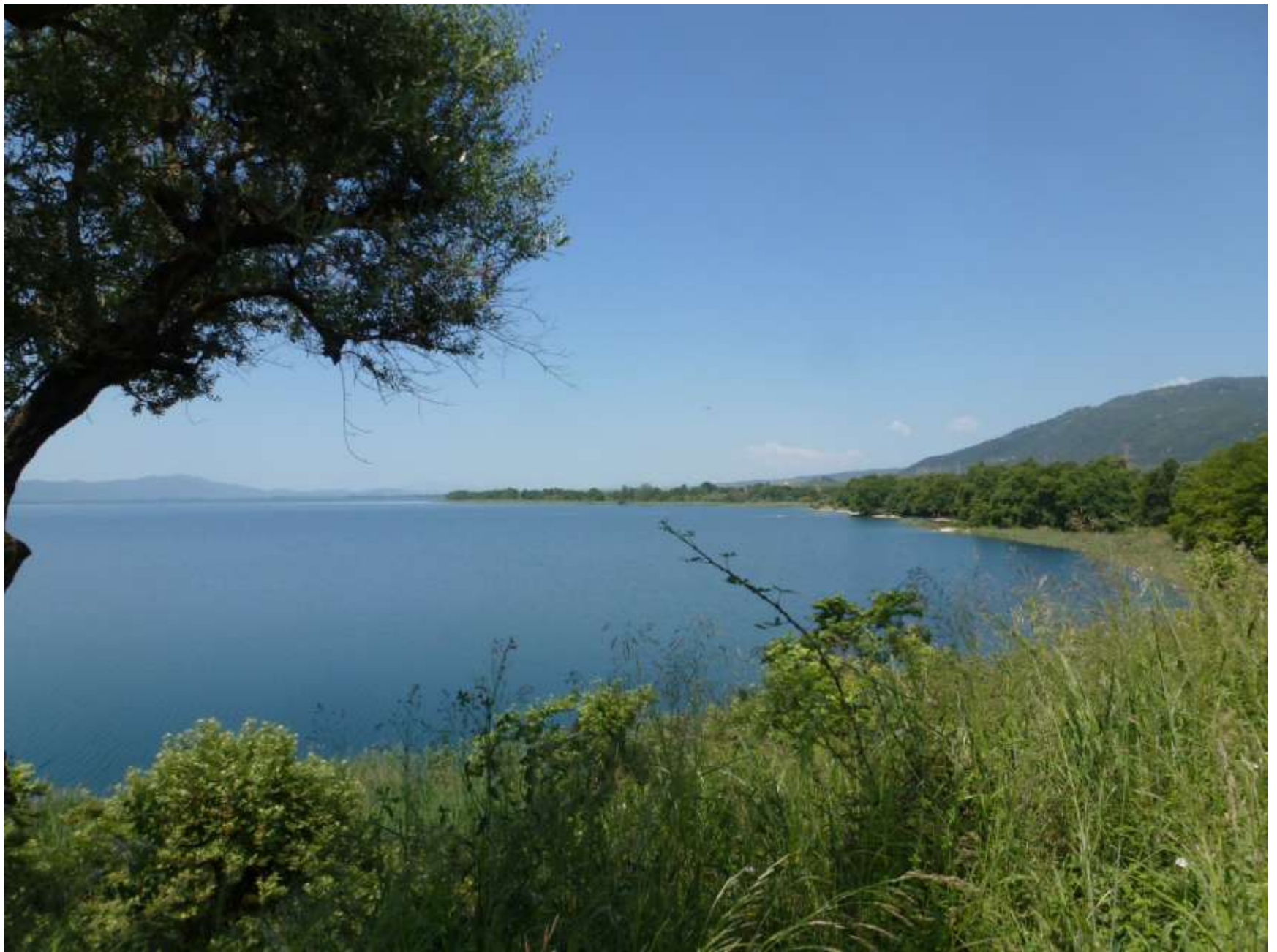
Η .....ακροπελαϊά... του χωριού μας.