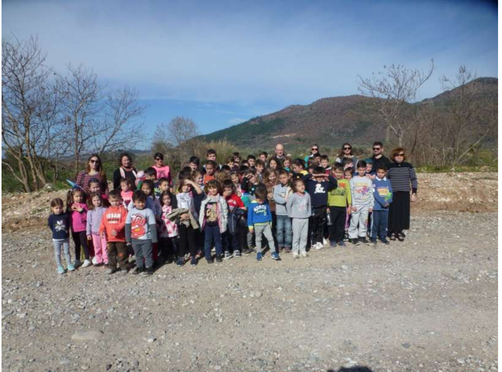
Το Δημοτικό Σχολείο Παντάνασσας σε δενδροφύτευση στον Ξηριά το 2017.