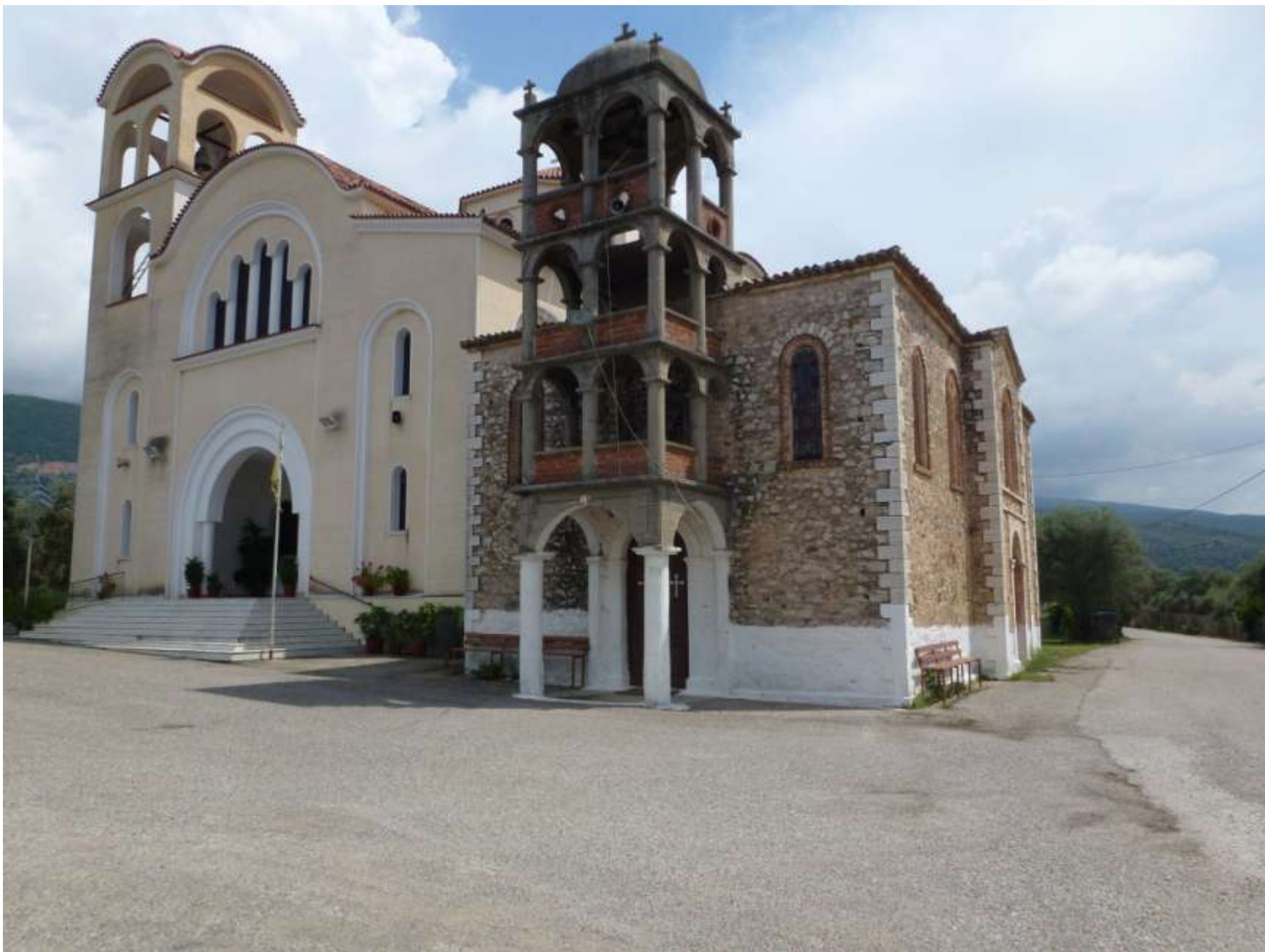
Ο παλιός και ο νέος Ιερός Ναός των Εισοδίων της Θεοτόκου του χωριού μας.