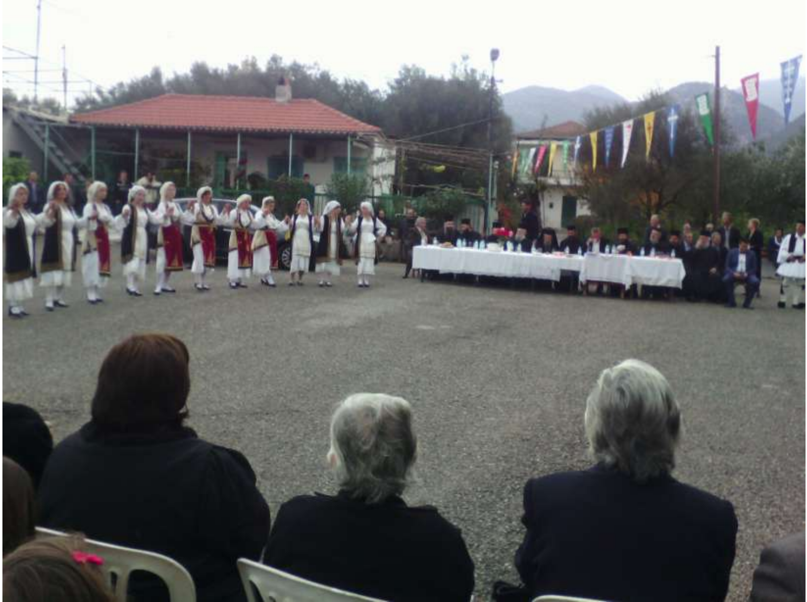
Από τη γιορτή μετά την τελετή «Εγκαινίων» του νέου Ιερού Ναού του χωριού μας το 2015.