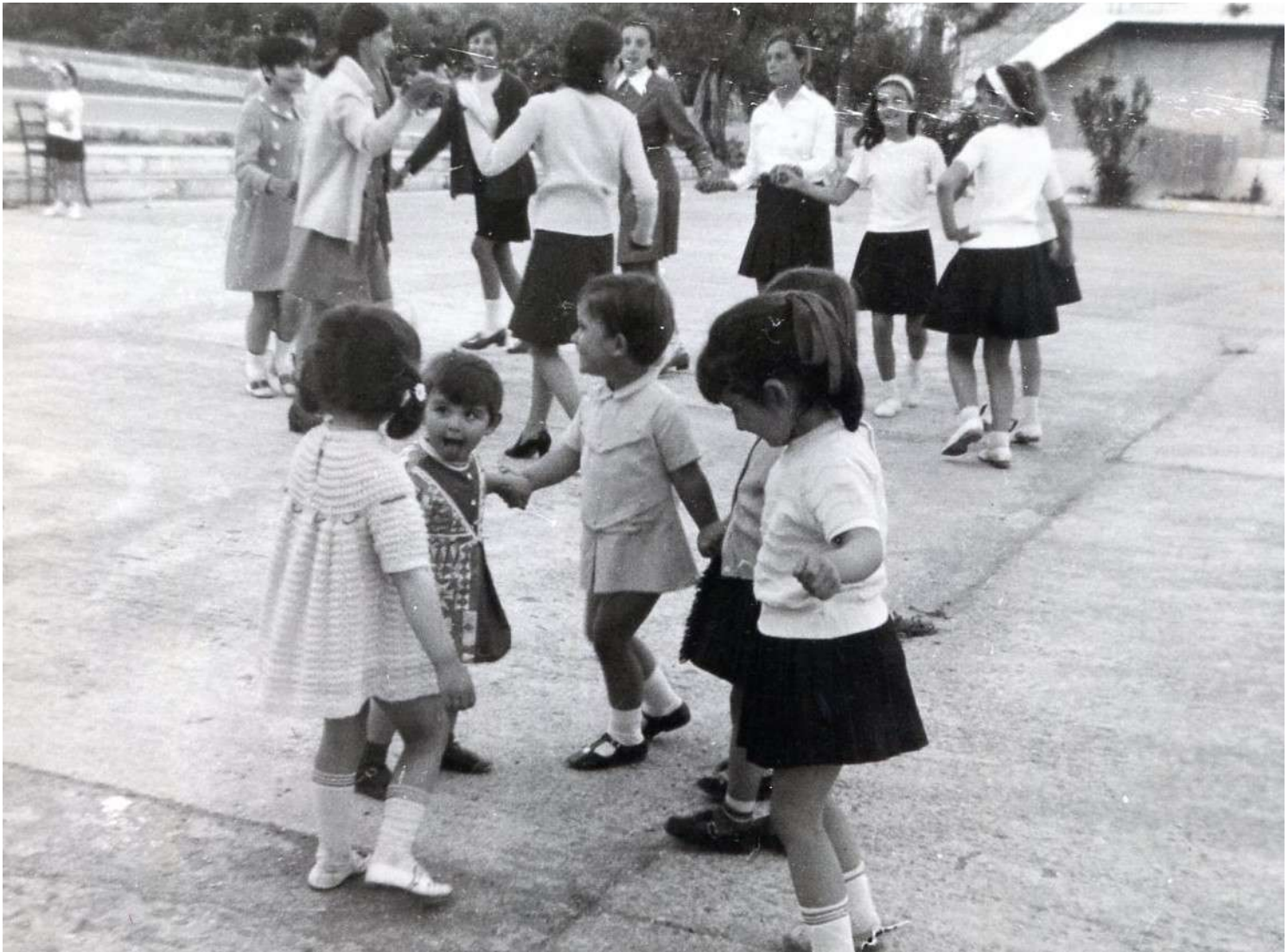
Αρχείο Δημ. Σχολείου Παντάναςσας «....μικροί μεγάλοι στο χορό.....»