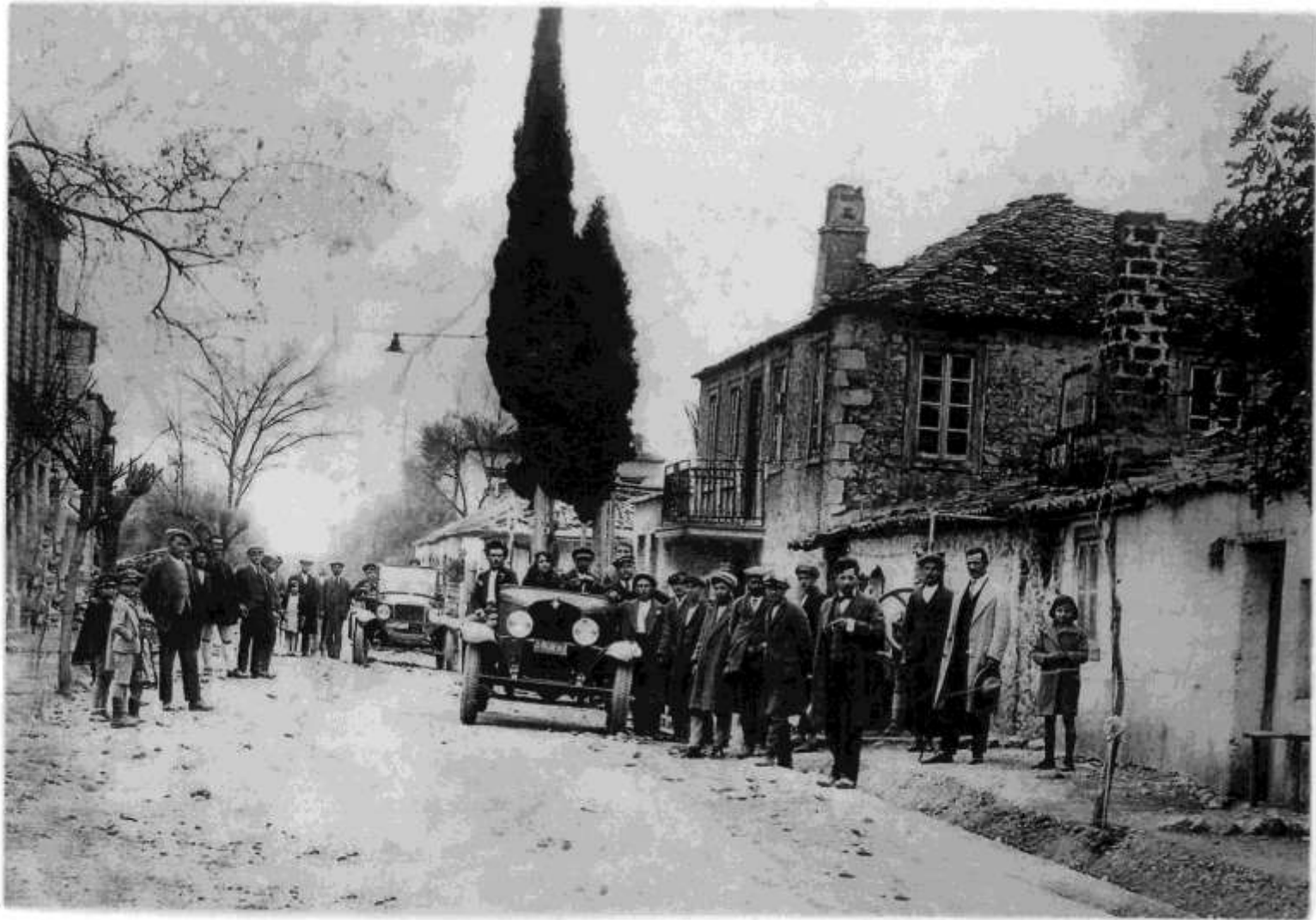
Άφιξη και υποδοχή των πρώτων αυτοκινήτων στο χωριό μας προπολεμικά.