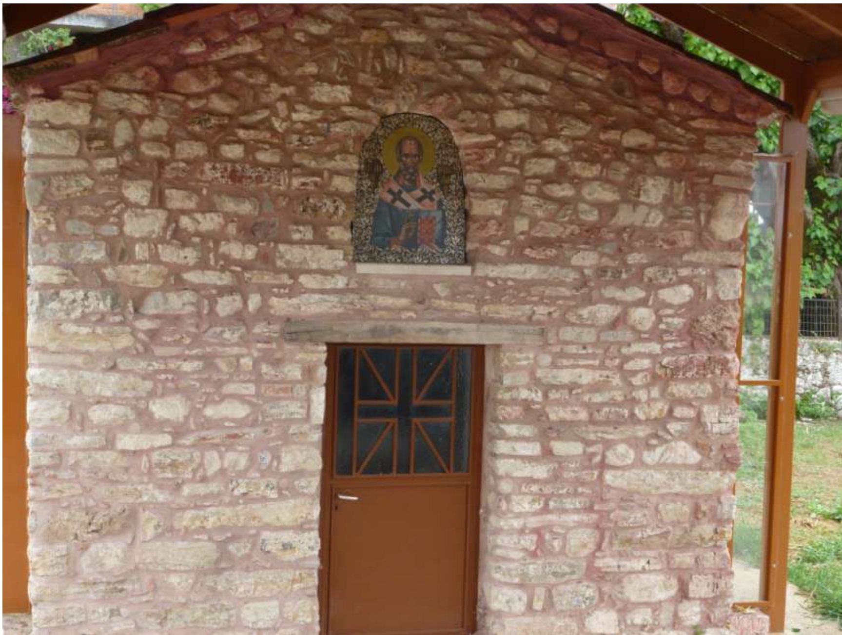
Η είσοδος του Αγίου Νικολάου στην Ντουγρή.