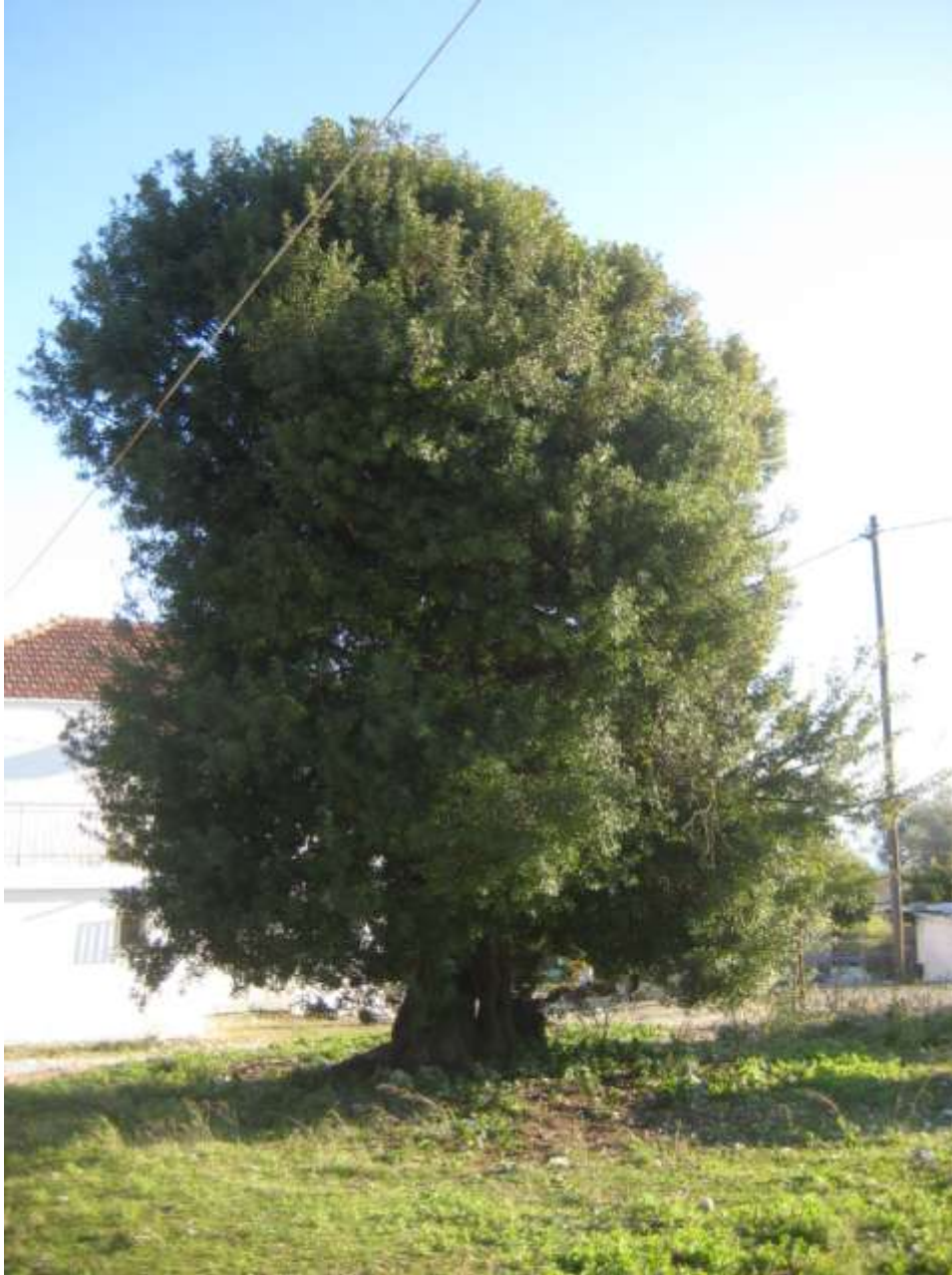
Δένδρα μνημεία της Φύσης. Ο σχίνος του Ντούλα στον Γαβριά.